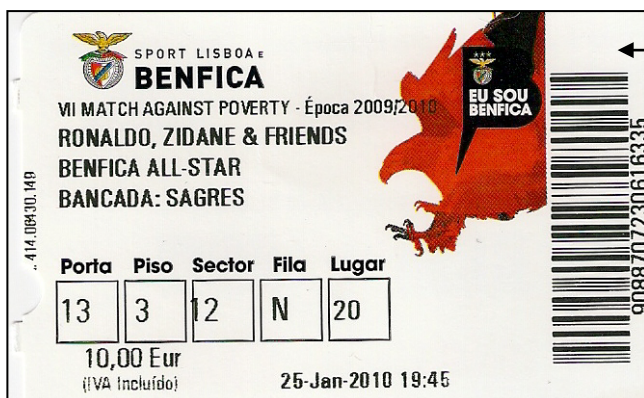
(Fig.3) Bilhete que deu acesso á entrada para ver o jogo que o Sport Lisboa Benfica organizou em solidariedade com o povo do Haiti

diz o povo “ Uma desgraça não vem só ” o Haiti sofre um violento sismo que acaba de derrubar a capital Porto Príncipe. Felizmente muitos países reapoderam aos apelos de ajuda humanitária, prometendo fundos, diversas expedições de rasgaste, equipas médias e engenheiros. Segundo notícias que nos tem chegado através da imprensa, o país ficou sem sistemas de comunicação, transportes aéreos, terrestres e aquáticos. A maioria dos hospitais e redes eléctricas foram todos danificados. A razão deste meu artigo é para salientar A ATITUDE DE SOLIDARIEDADE FEITA PELO SPORT LISBOA E BENFICA , tendo organizado um jogo que opôs velhas glorias e muitas estrelas do Benfica que muitas glorias deram ao clube , e os Amigos de Zidane, cujo o resultado foi o menos importante ficando empatados a 3-3 mas o que é de destacar foi A RECEITA DESTA JOGO AONDE FORAM VENDIDOS CERCA DE 60.000 BILHETES QUE RENDEU MEIO MILHÃO DE EUROS, SENDO TODA DOAD AO POVO DO HAITI . O Benfica como clube multidesportivo, com um historial invejável, com um passado cheio de muitas glórias mais uma vez demonstrou que através dos todos os elementos do Benfica, jogadores, direcção, funcionários sócios e simpatizantes que estão sempre presente a ajudar nestas iniciativas de solidariedade. Não é por acaso que o SPORT LISBOA E BENFICA É CONSIDERADO A NIVEL MUNDIAL COMO UM DOS MELHORES CLUBES DO MUNDO, E FOI CONSIDERADO PELA “ IFFHS ” COMO O NONO MELHOR CLUBE DO SÉCULO XX.