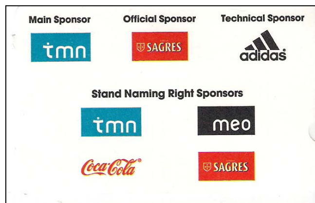
(fig. 4) Verso do Bilhete →